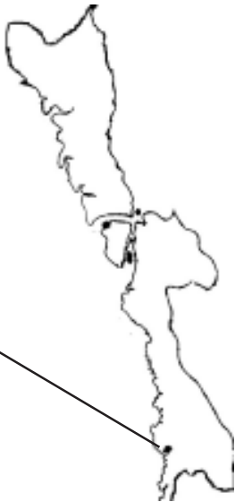
မွန်ပြည်နယ်မြေပုံ