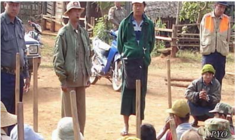
ဆီဆိုင်ရဲတပ်ဖွဲ့က သိမ်းထားသောလယ်ယာမြေများမှာ ပအိုဝ်းရွာသားများအား အလုပ်စေခိုင်းလျက်ရှိသည်။

(၂၀၀၇) ခုနှစ်၊ နိုဝင်ဘာလမှ (၂၀၀၈) ခုနှစ် ဇန်နဝါရီလ (၁) ရက်နေ့အထိ၊ ရှမ်းပြည်နယ်၊ ထောဒေးကျေးရွာမှ ရွာသားများကို မြန်မာစစ်တပ်က သီတင်းတပတ်လျှင် (၂) ကြိမ်၊ (၃) ကြိမ် ပေါ်တာလိုက်ခိုင်းနေရာ နောက်ဆုံး၌ ရွာရှိ အိမ်ထောင်စု (၁၆) စုအနက် (၉) စု ထွက်ပြေးသွားရတော့သည်။ ၄၇