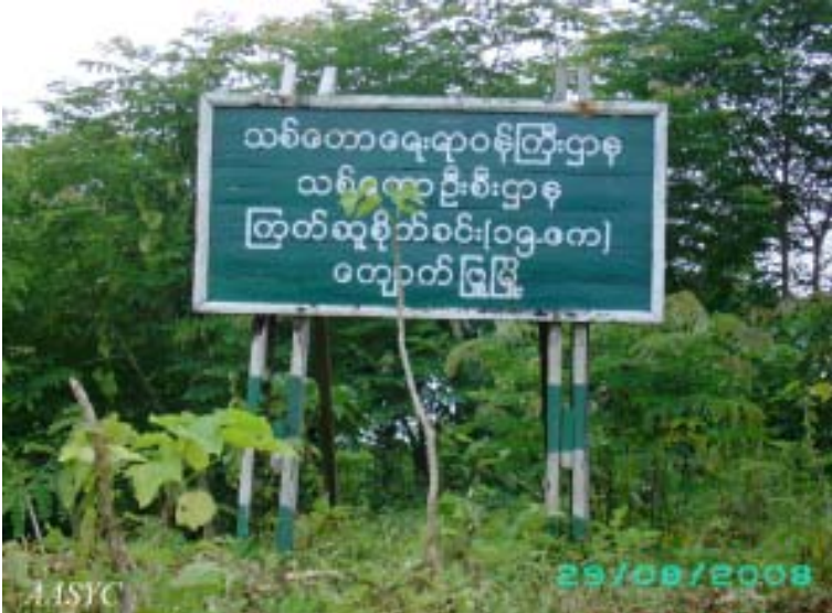
ကျောက်ဖြူမြို့ရှိ (၁၅)ဧကရှိသော ကြက်ဆူပင် စိုက်ခင်း

ထိုလအတွင်းမှာပင် အမှတ် (၉၆၂) စစ်အင်ဂျင်နီယာတပ်ဆွယ်က ထိုနယ်မြေ၌ လယ်မြေ (၃၅) ဧကကို သိမ်းယူပြီး အမှတ် (၈) စစ်မြေပြင် ဆေးတပ်ရင်းကလည်း စစ်တွေ-ရန်ကုန် အဝေးပြေးလမ်းပေါ်ရှိ ယိုးဝန်းနှင့် သရက်ချိုကျေးရွာအကြားမှ လယ်မြေ (၃၁.၅) ဧကကို သိမ်းခဲ့သည်။ နေရာတိုင်းမှာပင် လယ်သမားများအနေနှင့် မိမိတို့၏ အသိမ်းခံထားရသော လယ်ကိုပြန်လုပ်လိုပါက “စပါးတင်း (၆၀)” ပေးဆောင်ရမည်ဟု သတ်မှတ်သည်။ ၃၄