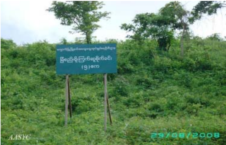
ကျောက်ဖြူမြို့နယ်အတွင်းရှိ (၅)ဧကရှိသော ကြက်ဆူပင်စိုက်ခင်း