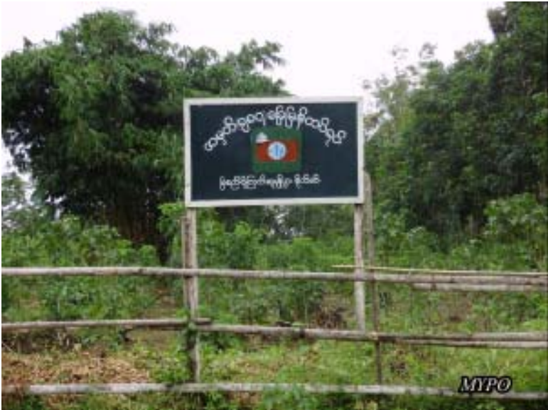
ရေးမြို့နယ်ရှိ (ခမရ) (၅၈၇)၏ ကြက်ဆူပင်စိုက်ခင်း