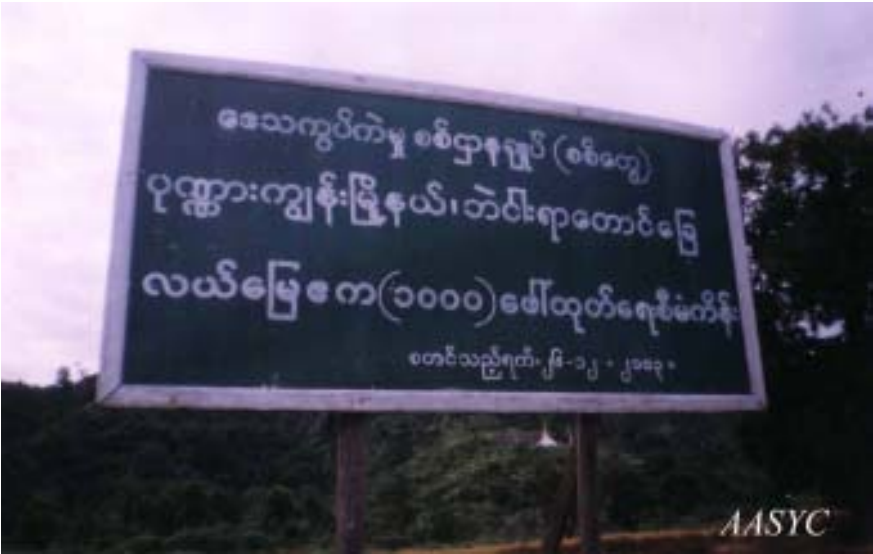
မြေဧက (၁၀၀၀)ကျော်သိမ်းယူကြောင်း အသေးစိတ်ဖော်ပြချက်

ကုလားတန်မြစ် အနောက်ဘက်ကမ်းရှိ အဝေးပြေးလမ်းမကြီးတလျှောက် ပန်းနီလာနှင့် ကျင်ခင်ကျေးရွာ အကြား နှင့် ပုဏ္ဏားကျွန်းမြို့နယ်အတွင်းရှိ မြေဧက (၁, ၀၀၀) ကို စစ်တွေ စစ်ဌာနချုပ် အမှတ် (၂၀) က ထပ်မံ၍ သိမ်းပြန်သည်။ ၃၁