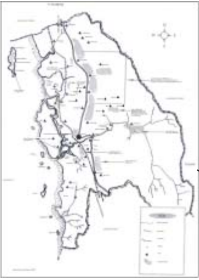
ရဲမြို့နယ်